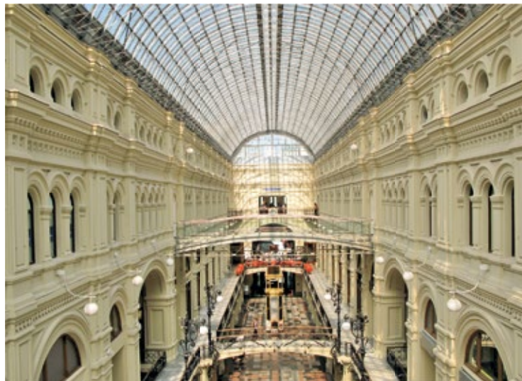
Piękne wnętrze domu handlowego GUM

Budynek przypominający piramidę został wzniesiony w 1930 r. według projektu Aleksieja Szczusiewa jako miejsce spoczynku zabalsamowanego ciała bolszewickiego przywódcy, które od 1924 r. było eksponowane w prowizorycznej drewnianej budowli.