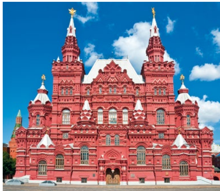
Fasada Państwowego Muzeum Historycznego